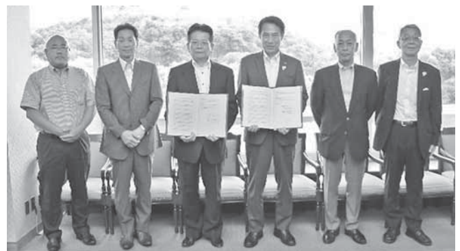
尾花市長と市長室で

そのような中、今年度、孤独死を未然に防ぎ、気になる高齢者を早期発見し、必要なサービスへつなぐため5月29日に和歌山市と和歌山市高齢者等の見守りの協力に関する協定書を締結しました。また、7月11日にはわかやま市民生活協同組合とともに和歌山県との高齢者等の見守り協力に関する協定を締結しました。(紙面の都合上この様子は次回の協会だよりで紹介させていただきます。)