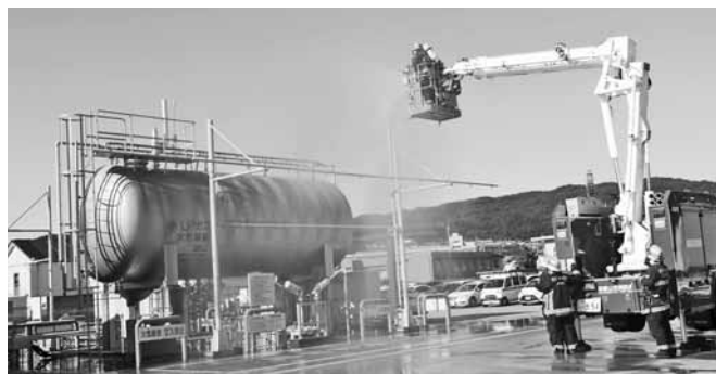
専用車両による放水

和歌山市消防局北消防署紀伊分署消防隊員の皆様のキビキビとした動きが訓練により一層の緊張感をもたらせてくれました。