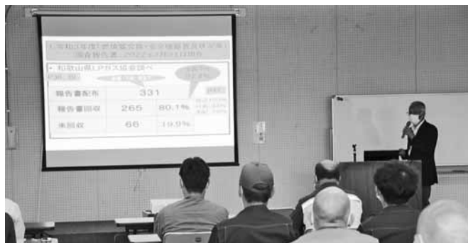
那智勝浦町体育文化会館にて