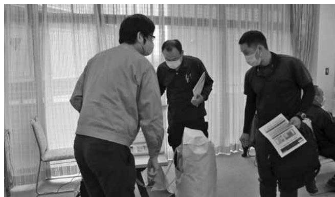
不燃シートの質疑応答