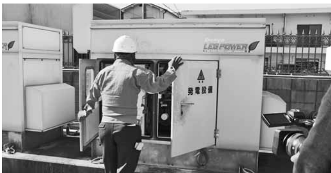
非常用発電機稼働