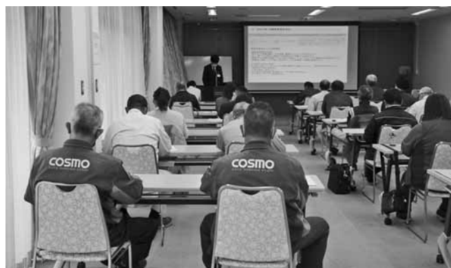
和歌山市 プラザホープにて